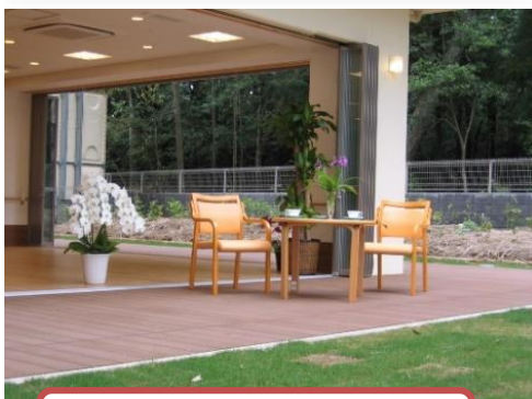
ウッドデッキでティータイム